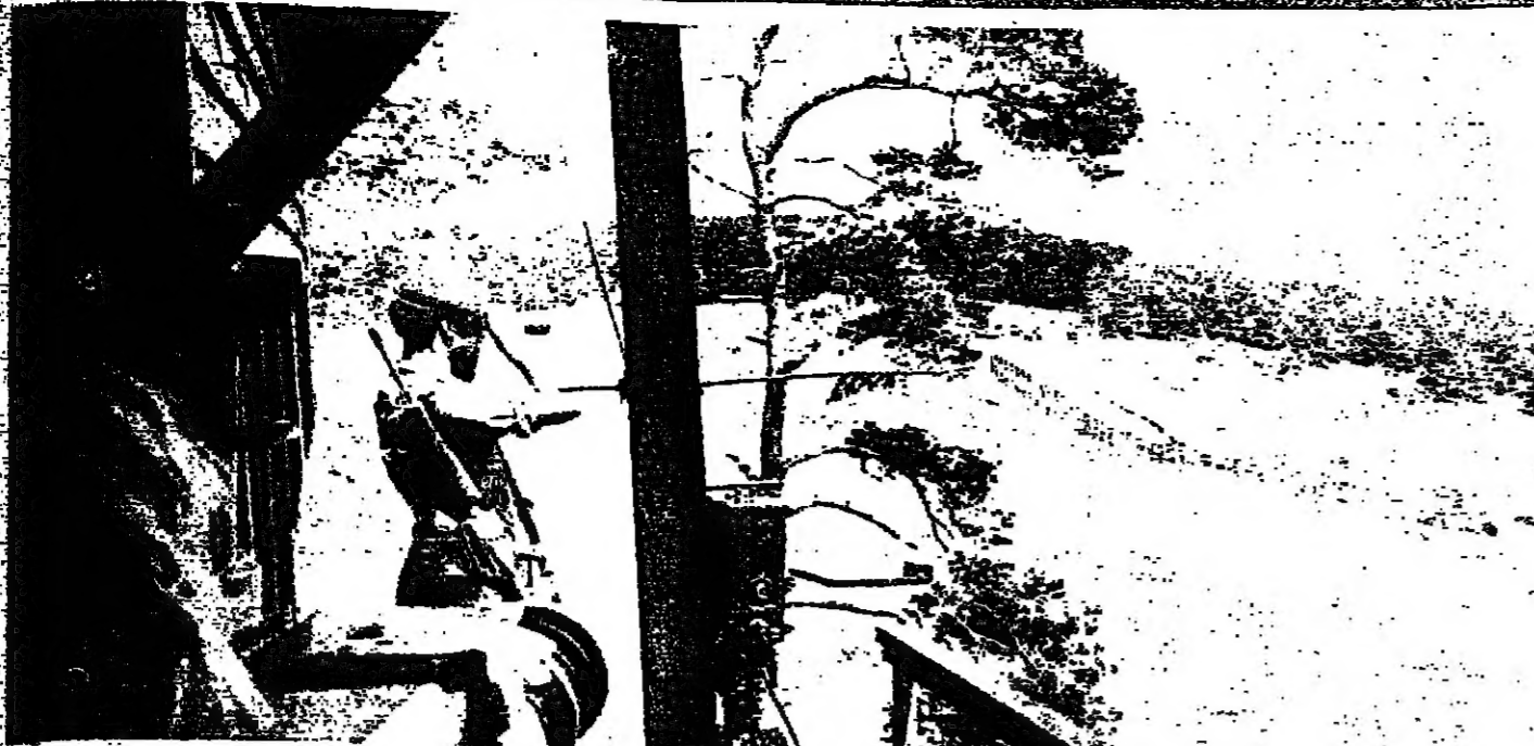
جندي من فرقة الخيالة ، يرافقه حركت على الحدود